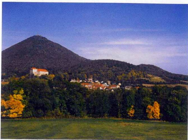
Milešov a Milešovka

Turistika. České středohoří je vhodné zejména pro pěší turistiku a cykloturistiku. V CHKO se nachází více než 500 km značených turistických cest, vyznačená síť cyklotras a cyklostezek. Páteří je tzv. labská cyklostezka č. 2, která vede po pravém břehu Labe a cyklostezka č. 25 (Most – Doksy), protínající západní část Středohoří. Na území CHKO se nachází naučných stezek. Správa CHKO České středohoří pečuje o tři z nich: Boreč, Lovoš a Pod Vysokým Ostrým. Mnohé vrcholy a vyhlídky umožňují za příhodných podmínek rozhlédnout se daleko po kraji.