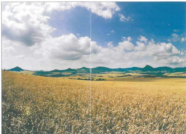
Část Milešovského středohoří (od jihu)

České středohoří osloví návštěvníka neopakovatelným typem krajiny, jehož obdobu bychom marně hledali v České republice i v okolních státech střední Evropy. Z hlediska výskytu rostlinných a živočišných druhů i jejich společenstev patří toto území k nejbohatším u nás.